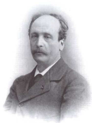
LOUIS OSCAR ROTY, 1846 - 1911

Louis Oscar Roty, que firmaba sus obras O. Roty, nació en París el año 1846, inició una carrera de estudios artísticos, primero de pintura y después de escultura, con los que consiguió varios premios, uno de ellos, el Gran Prix de Roma de 1875, que incluía para el ganador una beca en la escuela de la Villa de Medicis. Durante los tres años en que estuvo en Roma, realizó diversas esculturas y medallas, iniciándose en la disciplina del bajorrelieve.