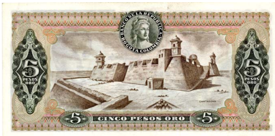
Cinco pesos, Banco de la República, 1961.

El otro billete muy representativo de la ciudad de Cartagena, es el emitido por el Banco de la República de Colombia por valor de cinco pesos, de enero 2 de 1961 (salió en varias fechas), en el cual encontramos por el reverso, en todo el campo, una vista del Castillo de San Felipe, construcción que domina la ciudad.