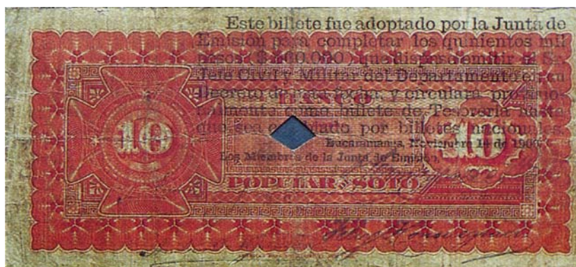
Billete del Banco Popular de Soto de diez pesos, resellado por el reverso, 1900