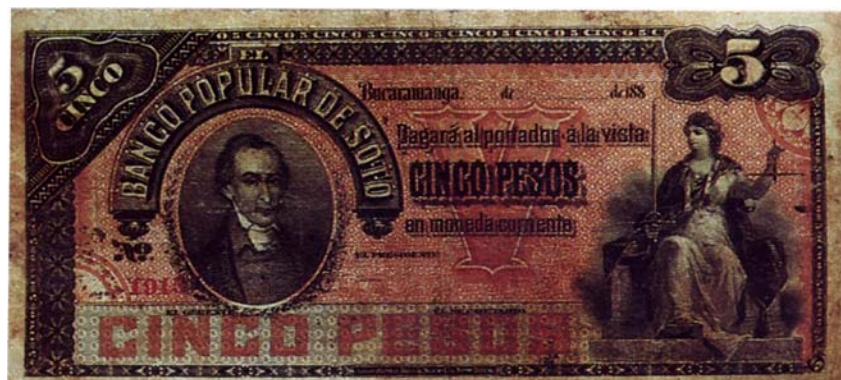
Billete del Banco Popular de Soto de cinco pesos, resellado por el reverso, 1900