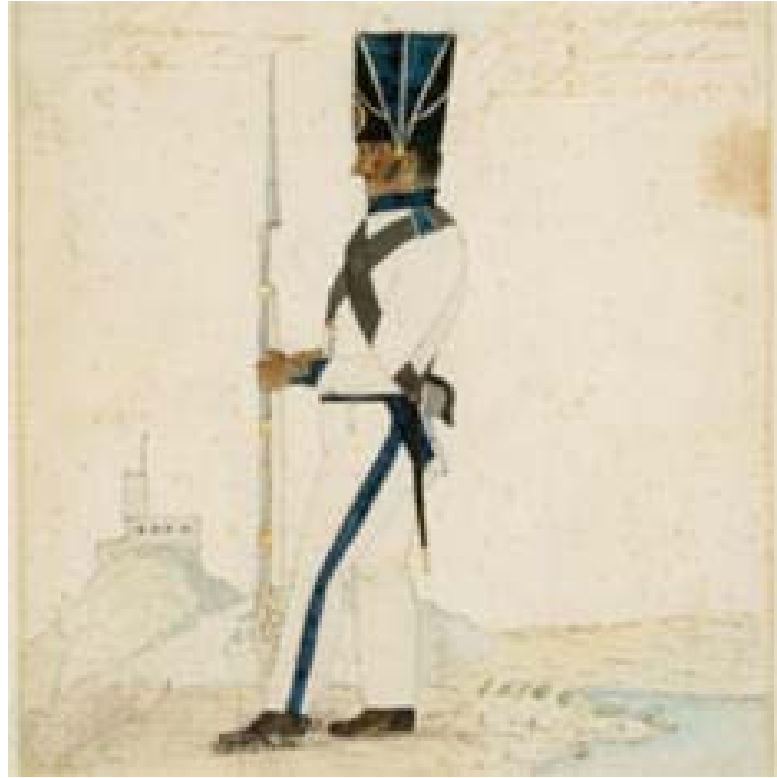
Imagen de presentación de la exposición

territorio, lograr el reconocimiento de Colombia como república independiente ante las potencias europeas y afianzar las nuevas instituciones republicanas". No olviden que la entrada es gratuita, desde las 9 a.m. hasta las 5 p.m.