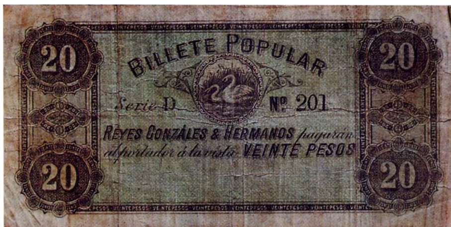
Billete popular de veinte pesos, resellado por el reverso, 1900