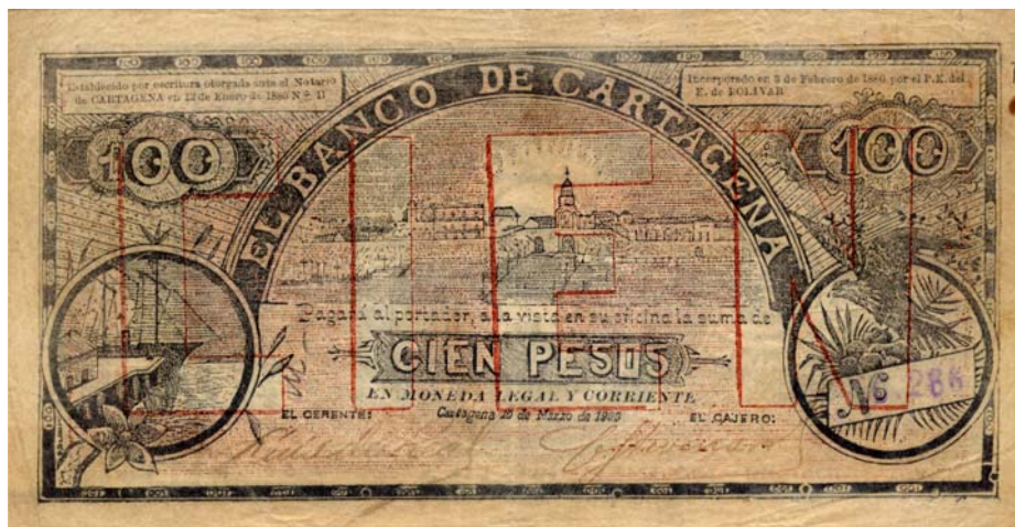
Cien pesos, Banco de Cartagena, 1900.

Para recordar esta importante efeméride hemos seleccionado dos billetes representativos de la ciudad de Cartagena. El primero es el billete de cien pesos del Banco de Cartagena del 10 de marzo de 1900, pick 351, el cual nos muestra una panorámica de la ciudad de Cartagena con su torre del reloj y sus murallas. Viñetas, a la izquierda, un barco junto a un muelle; y a la derecha, un águila entre ramas y la numeración del billete. Firmas del gerente y del cajero del banco. Los colores predominantes son el blanco, rojo y negro.