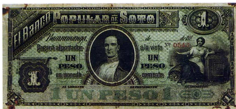
Billete del Banco Popular de Soto de un peso, resellado por el reverso, 1900

Enseguida les compartimos billetes del Banco Popular de Soto resellados por el reverso y adoptados por la Junta de Emisión. Todos tienen el mismo resello por el reverso, como puede verse en el de diez pesos.