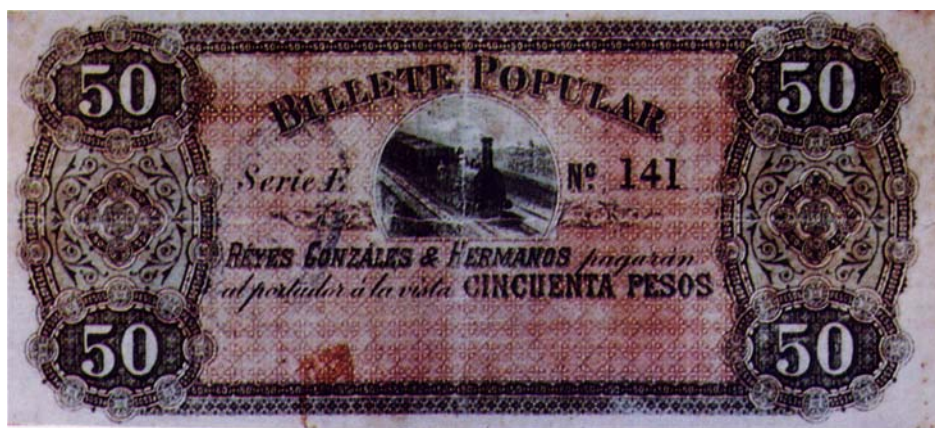
Billete popular de cincuenta pesos, resellado por el reverso, 1900

Enseguida les compartimos billetes del Banco Popular de Soto resellados por el reverso y adoptados por la Junta de Emisión. Todos tienen el mismo resello por el reverso, como puede verse en el de diez pesos.