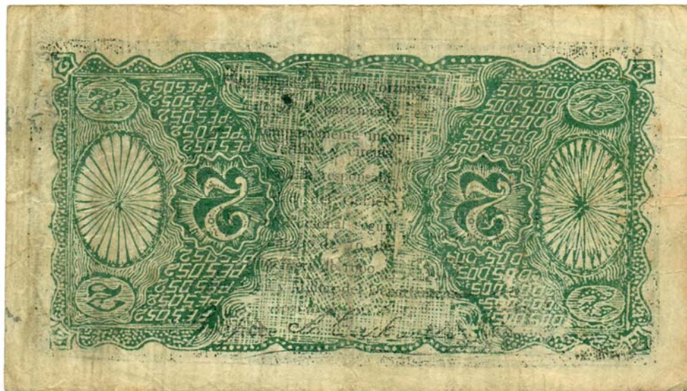
Banco de Barranquilla, dos pesos, 1900. (Reverso invertido)