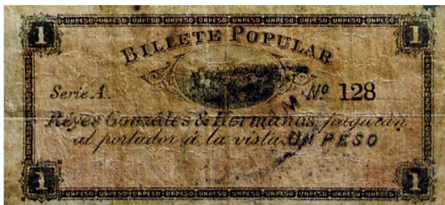
Billete popular de un peso, resellado por el reverso, 1900

A continuación, les mostramos billetes populares de Reyes González & Hermanos resellados por el reverso y adoptados por la Junta de Emisión. Todos tienen el mismo resello por el reverso, como puede verse en el de diez pesos.