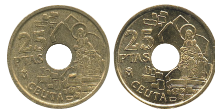
OFRENDA DERECHA. 25 pesetas año 1998