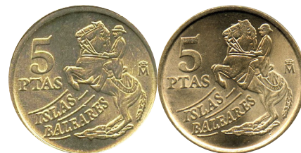
QUINTA PATA. 5 pesetas año 1997