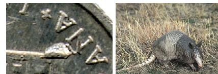
ARMADILLO. 1 peseta año 1997