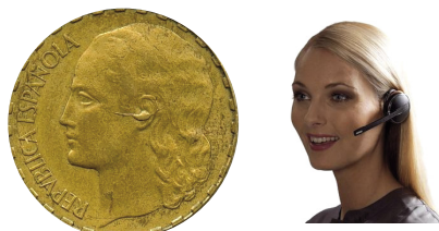
MICRÓFONO INHALÁMBRICO. 1 peseta año 1937

A continuación se exponen una serie de ejemplos, quizás los más conocidos, pero que no son más que una mínima representación de éste tipo de variantes. Las imágenes de la izquierda son las variantes.