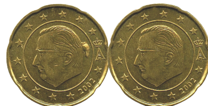
COLETA. 20 céntimos año 2002