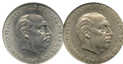
MOSTACHO. 5 pesetas 1949