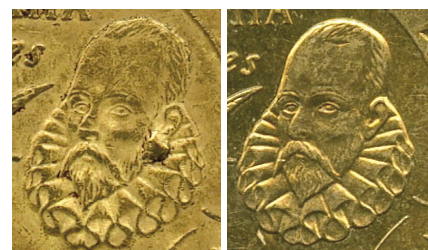
PENDIENTE. 20 céntimos año 1999